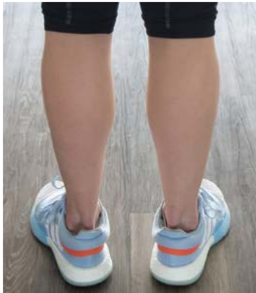
Anatomisch richtige Fußstellung